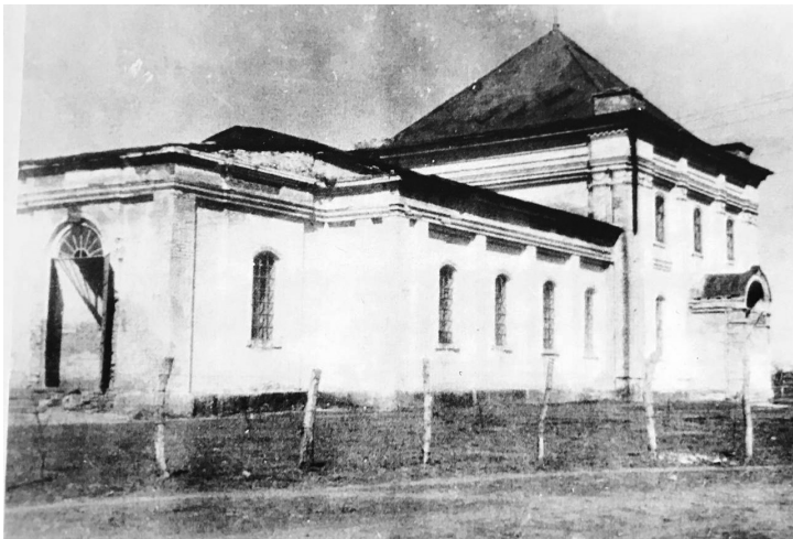
Рис. 2. Здание Казанской церкви в станции Семикаракорской. 1955 г.